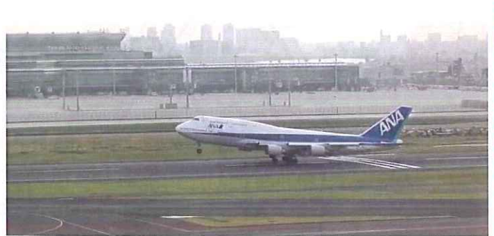
ANA B747-481D と建設中の新国際空港（左：RW34Lに着陸 右：RW16Rから離陸）