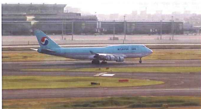
KOREAN AIR B747-400