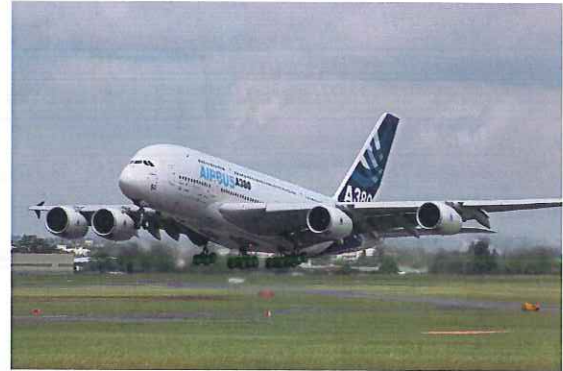
AIRBUS A380 の透視図と機体