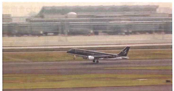
STARFLYER AIRBUS A320