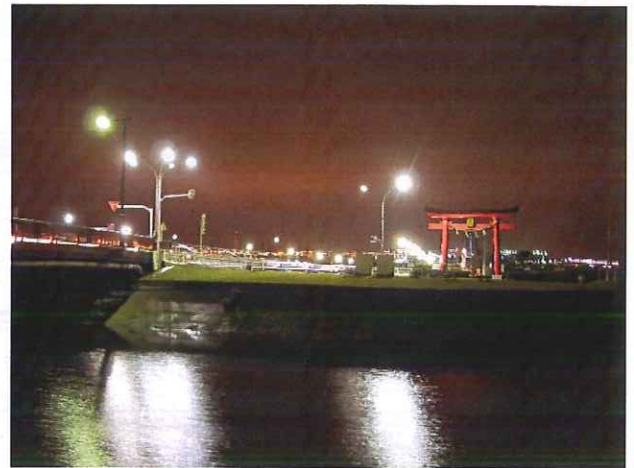
現在の鳥居（天空橋近く）

そんな羽田空港ですが、これから先も何十年と増築や改築がされていくと思います。そこには、それを計画する人、作る人、守る人、働く人、お客さん、たくさん人間が24時間365日休むこと無く働いています。そのようなこれからの日本の玄関口、日本の顔となる巨大建造物の建設の一部ではありますが、我々も携わっていること、携わっていったことに誇りを持って頂きたいと思います。