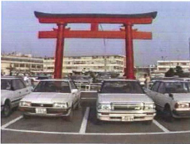
駐車場内にあった鳥居（～1999年）