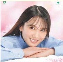
建設業 年度末 令和3年3月1日～3月31日 / 労働災害防止強調月間

本月間 : 令和5年3月1日～3月31日 主 唱 : 建設業労働災害防止協会 後 援 : 厚生労働省、国土交通省